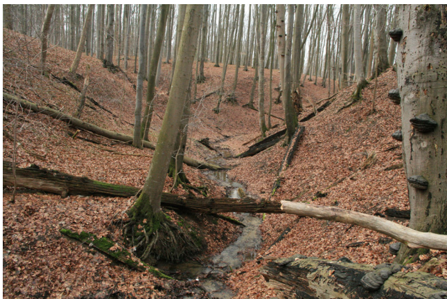
Abb. 7: Bachtal bei Tatow (Fundort 20), Buchen-Ahorn-Eschenwald.

Als großes Problem erweist sich mittlerweile das Eschentriebsterben, welches durch einen in den letzten zwei Jahrzehnten in Norddeutschland etablierten, aus Ostasien stammenden Pilz ( Hymenoscyphus fraxineus ) verursacht wird. An fast allen nach zwölf bis 17 Jahren vom Autor erneut aufgesuchten Platyla -Fundorten sind zahlreiche Eschen abgängig oder wurden gezielt entnommen, um die Stämme vor der Zerstörung durch den Pilz einer Nutzung zuzuführen. Unter den verbliebenen Exemplaren machen oft nur wenige einen völlig gesunden Eindruck. Schon allein aufgrund der geringen Zeitspanne konnten bisher in MV keine signifikanten Auswirkungen des Eschentriebsterbens auf die Molluskenpopulationen von Waldökosystemen festgestellt werden.