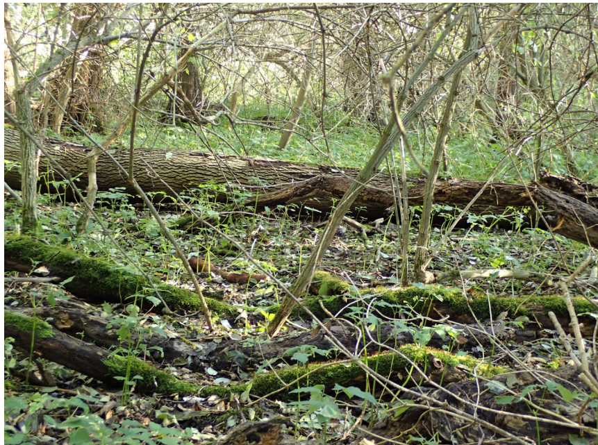
Abb. 5: Bachtal bei Krusenhagen (Fundort 18), Ahorn-Erlen-Eschenwald mit sehr viel Holunder, in der Krautschicht Giersch flächendeckend, im Hintergrund umgestürzte Esche.

– Fundort 18 (Abb. 5): In einem entwässerten Bachtal bei Krusenhagen lebt die Art individuenreich in einem stark degradierten Ahorn-Erlen-Eschenwald mit extremer Häufigkeit von Giersch, Großer Brennnessel und Schwarzem Holunder auf stark mineralisiertem Torfboden (2003: 21, 2020: 45 lebende Tiere aus jeweils ca. fünf Liter Substrat).