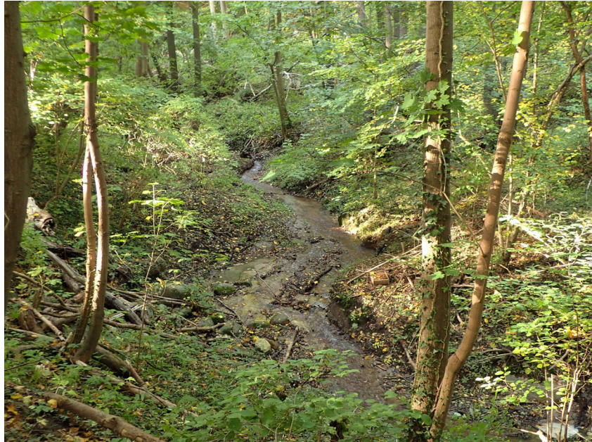
Abb. 6: Bachtal bei Roxin (Fundort 22), Ahorn-Erlen-Eschenwald mit Quellsümpfen.

Es ist erstaunlich, dass diese anspruchsvolle Art selbst starke anthropogene Beeinträchtigungen ihrer Biotope tolerieren kann, so lange dauerhafte Feuchtigkeit und eine gut entwickelte Mulmschicht zumindest kleinflächig vorhanden sind. In diesem Zusammenhang ist allerdings ein gewisser Verzögerungseffekt beim Erlöschen von Molluskenpopulationen zu berücksichtigen, der leicht zu einer Fehlinterpretation der Gefährdungssituation führen kann (FALKNER 1990). Die Aussage FALKNERS, dass sich selbst anspruchsvolle Landschneckenarten unter stark verschlechterten Biotopbedingungen mitunter jahrelang halten, kann durch vielfältige eigene Beobachtungen bestätigt werden.