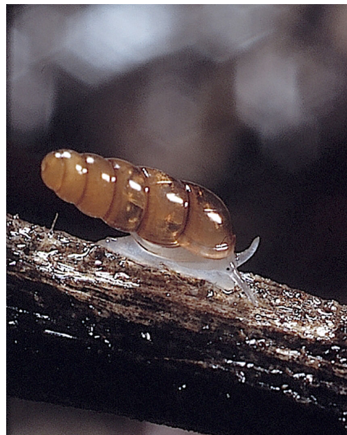
Abb. 1: Platyla polita , Faulenroster Holz (Fundort 34).

In Deutschland kommen sechs Arten der Familie Mulmnadeln (Aciculidae) vor, von denen allerdings nur eine, die Glatte Mulmnadel Platyla polita (W. HARTMANN 1840) (Abb. 1, 2), das Norddeutsche Tiefland besiedelt (z. B. WIESE 2014). Nachweise in diesem Gebiet gelten traditionell als Besonderheit, was zum einen der zerstreuten Verbreitung, zum anderen aber auch der schwierigen Auffindbarkeit des maximal 3,8 mm Gehäusehöhe erreichenden Land-Prosobranchiers geschuldet ist. In Mecklenburg-Vorpommern (MV) lange Zeit als eine der seltensten Molluskenarten geführt, konnte P. polita erst in den letzten zwei Jahrzehnten durch intensivere Kartierung, gekoppelt mit verbesserter Biotopkenntnis und Erfassungsmethodik, regelmäßiger gefunden werden.