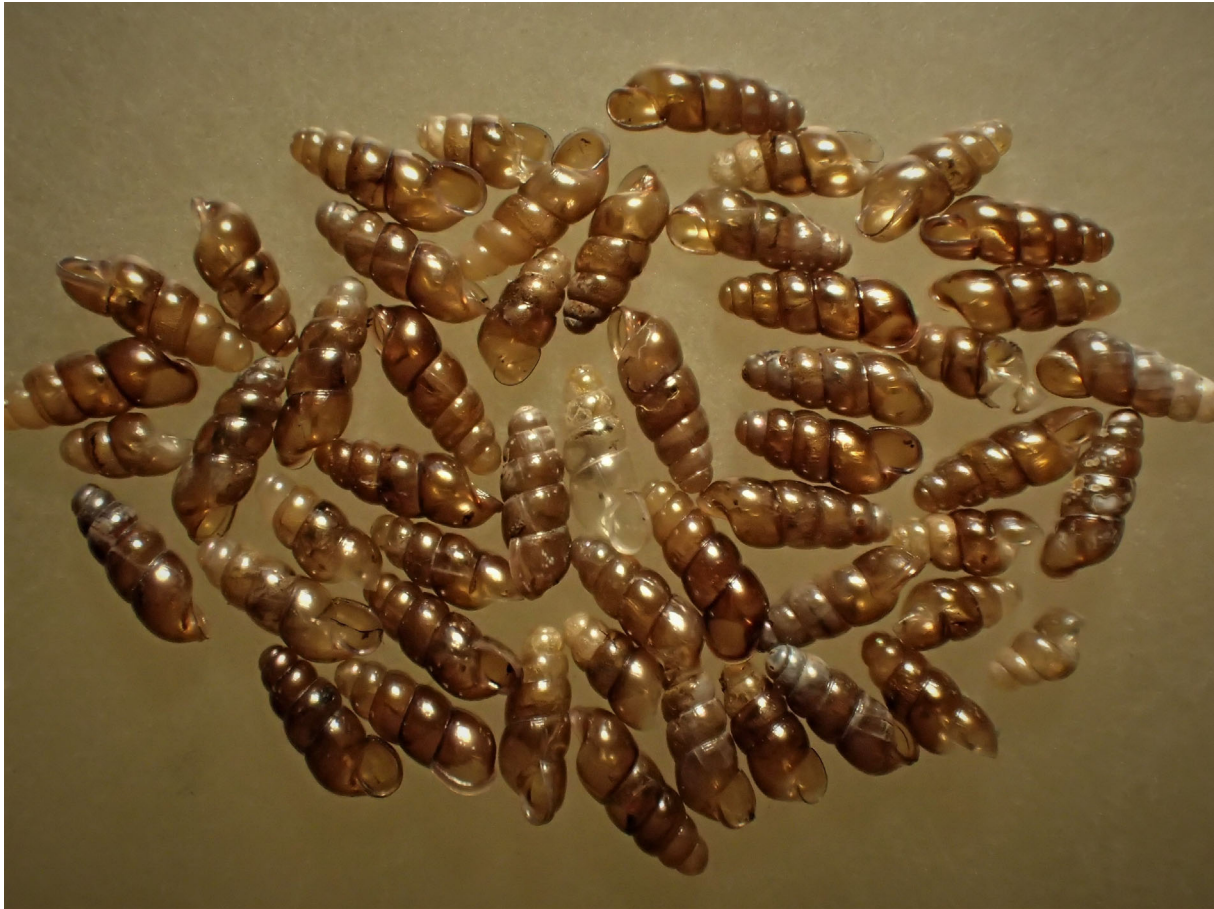
Abb. 2: Platyla polita , Neumühle bei Neukloster (Fundort 44) (Foto: H. MENZEL-HARLOFF).

Die vorliegende Arbeit versteht sich als Zusammenfassung des aktuellen Kenntnisstandes zur Verbreitung und Ökologie von Platyla polita in MV sowie als kleiner Beitrag zur Faunistik einiger süd- und mitteldeutscher Bundesländer sowie Österreichs.